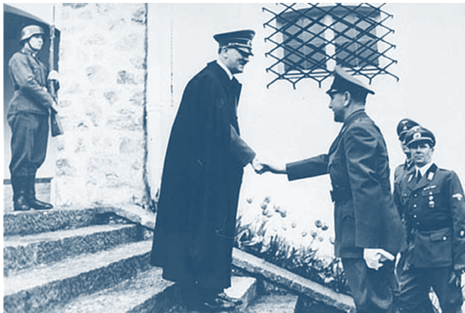
↑ La première rencontre d'Ante Pavelic avec Adolf Hitler, le 6 juin 1941. La photo montre le rapport hiérarchique entre les deux chefs d'État, mais celui-ci n'empêchait pas Hitler de prendre son partenaire croate au sérieux. La rencontre portait sur l'homogénéisation ethnique de l'Europe du Sud-Est.