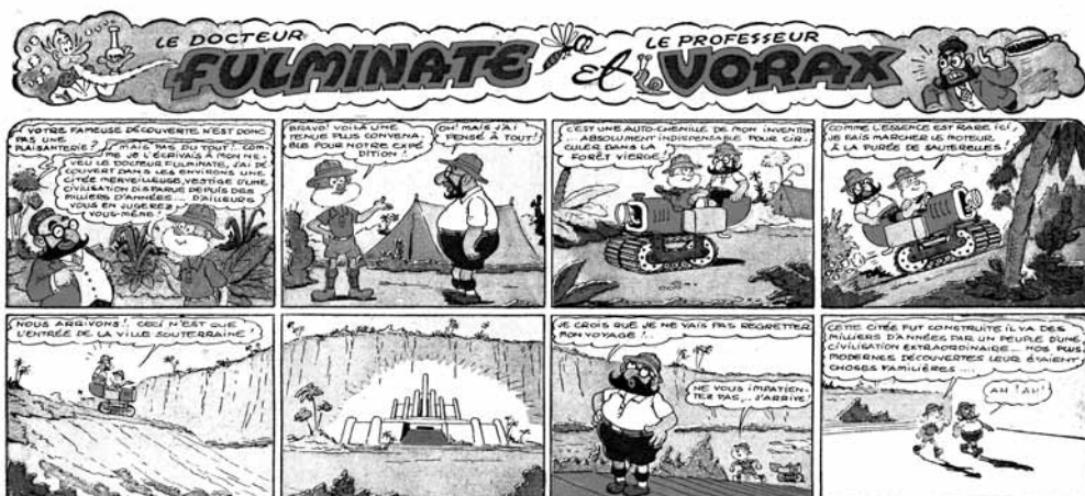
Ill. 4 / Le Docteur Fulminate et le professeur Vorax dessiné par Erik. Publié dans « Le Téméraire » n°20 du 1 er novembre 1943. (DR)

leur égard, justifiant toutes les mesures de répression de l'époque. Rare chez Vica, qui se met en scène dans une série humoristique sous les traits d'un marin et donne volontiers dans le grotesque et la surcharge, l'antisémitisme est permanent chez Érik et totalement intégré à la structure répétitive des gags de sa série, « Le Docteur Fulminate et le professeur Vorax » (ill. 4).