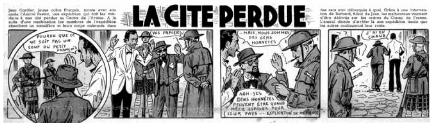
III. 2 / La Cité perdue de Robert Rigot à la une de « Cœurs vaillants », n°21, du 25 mai 1941.