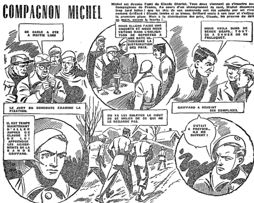
III. 1 / Extrait de la BD Compagnon Michel de Pellois parue dans «Robinson et Hop-Là réunis», page 3, n° 312 du 9 août 1942. (DR)

un intellectuel malingre, lâche et ridicule, et noue une amitié avec Claude Charlet, « un jeune montagnard qui entend l'initier à une vie saine et sportive ». Ils contractent un engagement aux Compagnons de France, félicités par l'oncle de Michel, « un colonial endurci ». Lors d'un concours de saut, Claude et Michel affrontent la fourberie d'un concurrent dénommé Griffard, au nez proéminent et crochu. Après ces péripéties, les deux héros accomplissent « leur stage de Compagnons de France dans un camp où la vie saine et virile les endurent ». Cette bande dessinée accumule tous les poncifs de la propagande de Vichy à destination de la jeunesse : construction d'une jeunesse forte grâce au sport en réaction à l'obsession d'une dégénérescence physique et morale de la société française à travers la transformation de Michel, excessif intellectualisme des études privant le pays d'hommes d'action suggéré sans aucune finesse par le personnage du précepteur et même valorisation de l'Empire à travers l'oncle de Michel. L'antisémitisme du régime est ici discrètement incarné par le méchant du récit. Cette bande incite les jeunes lecteurs à rejoindre un mouvement, les Compagnons de France, créés par Vichy à un moment où, malgré des efforts massifs, sa politique pour mettre la jeunesse de son côté provoque des réticences de plus en plus fortes.