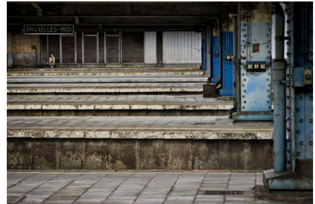
Gare du Midi / Zuidstation

25 484 Joden en 351 Zigeuners zijn vanuit SS Juden Sammellager Mecheln naar Auschwitz-Birkenau gedeporteerd. Slechts 5% van hen overleefde het, 1240 Joden en 32 Zigeuners.