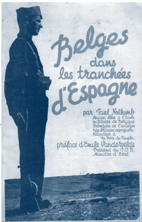
↑ Illustration 1

— De 1936 à 1939, pendant la Guerre d'Espagne, 32 000 enfants espagnols ont été évacués et ont trouvé refuge dans des familles et des centres d'accueil à l'étranger. 5 000 d'entre eux ont été (dé)placés en Belgique, où certains ont construit leur vie.