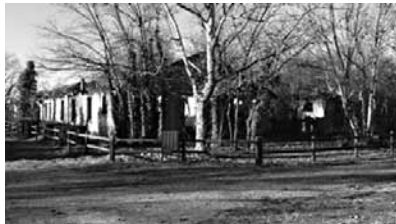
Restes du baraquement où fut interné Primo Levi.

Historiquement, cette zone comptait une centaine de bâtiments ; or, en l'état actuel, malgré les dégradations, il en restait trente-trois (parmi lesquels huit étaient destinés aux Juifs, sept aux détenus politiques et huit aux gardiens). Les dégâts sont considérables et concernent tous les édifices, surtout ceux des gardiens situés près de l'entrée historique et l'église construite par les Istriens, quand le site se nommait encore village San Marco.