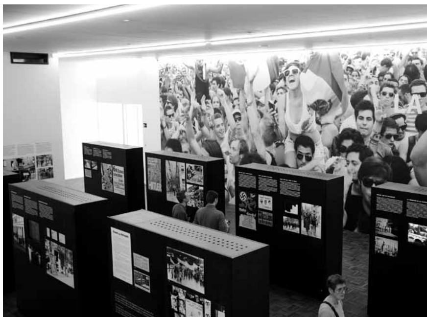
Eerste verdiep van de permanente tentoonstelling.