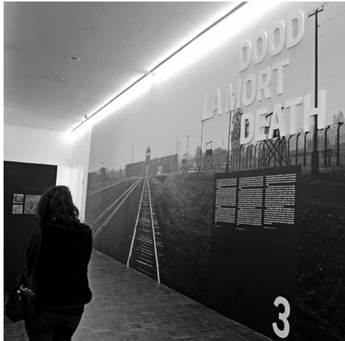
Troisième étage de l'exposition permanente.

Derde verdieping van de permanente tentoonstelling.