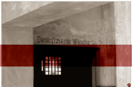
Ontsmettingszone in de Zentral Sauna