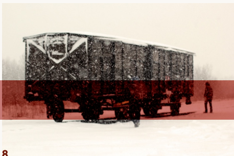
Wagen op de Alte Judenrampe