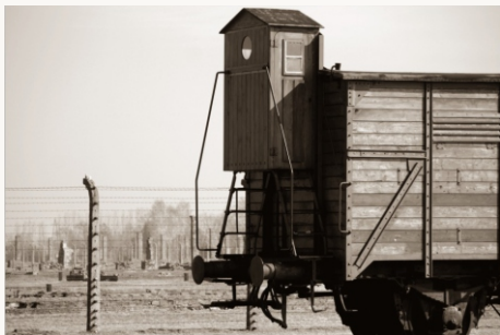
Deportatietrein - wagen met wachtcabine

Bahnrampe binnen de omheining van Birkenau