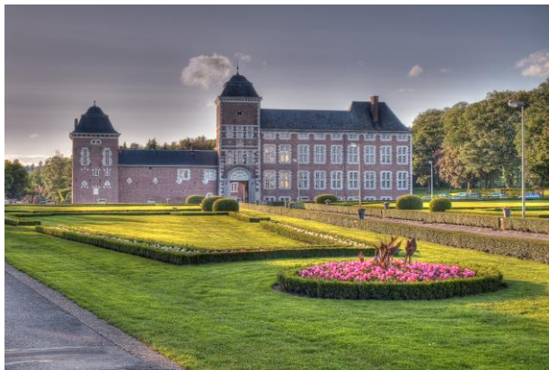
C'est dans le cadre idyllique du château de Wégimont que prit place le sombre Lebensborn « Ardennen » - Le Château Wégimont

Au départ, les Lebensborn sont limités à l'Allemagne et à l'Autriche. Ensuite, d'autres sont implantés en Norvège, au Danemark, aux Pays-Bas, en Belgique, au Luxembourg et en