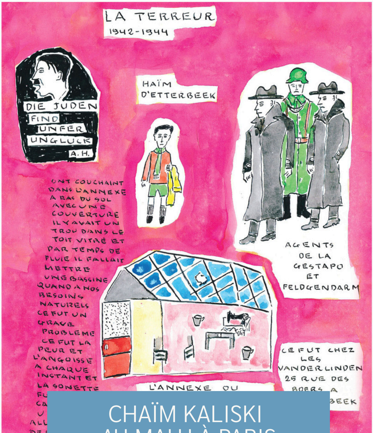
La Terreur, 1942-1944 - Anne d'Amsterdam, 1997 (détail); Encre de Chine et aquarelle de couleur; collection particulière

mahJ musée d'art et d'histoire du Judaïsme