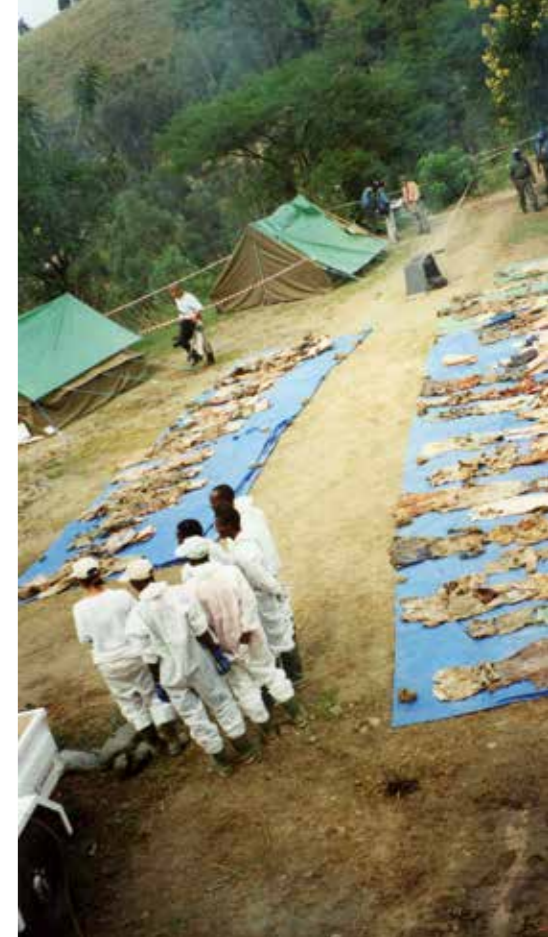
Massagraf in Rwanda.

Na het einde van de Tweede Wereldoorlog in 1945 wensten alle zegevierende landen vurig dat zoiets misdadigs en wreeds nooit meer zou gebeuren. Ze sloten hierover dan ook een internationale overeenkomst: het VN-Verdrag inzake de preventie en bestraffing van de misdaad van genocide (1948). Desondanks hebben er sindsdien op verschillende plaatsen in de wereld genocides en andere massale wreedheden plaatsgevonden. En telkens wanneer er zoiets gebeurde, verwezen politici, wetenschappers en verontruste burgers naar de geschiedenis en de 'lessen' van de Holocaust in een poging te verklaren hoe het mogelijk was dat de mensheid er wéér niet in geslaagd was om een genocide te voorkomen. Wat kunnen we leren over de preventie van genocides en andere massale wreedheden door de Holocaust en andere nazimisdaden te bestuderen?