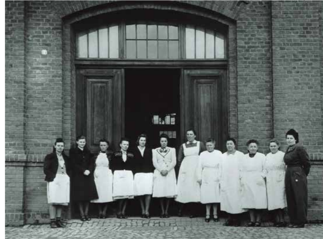
Het verplegend personeel van het 'euthanasiecentrum' Hadamar in Duitsland.

Holocaust, zullen ze ook zien hoe complex alles is en zullen ze zich realiseren dat dergelijke gebeurtenissen niet zomaar even kunnen worden verklaard, maar het resultaat zijn van tal van historische, economische, religieuze en politieke factoren. Deze wetenschap draagt op zijn beurt weer bij aan het besef dat de preventie van genocides en andere gruweldaden al kan beginnen met het (h)erkennen van alarmsignalen.