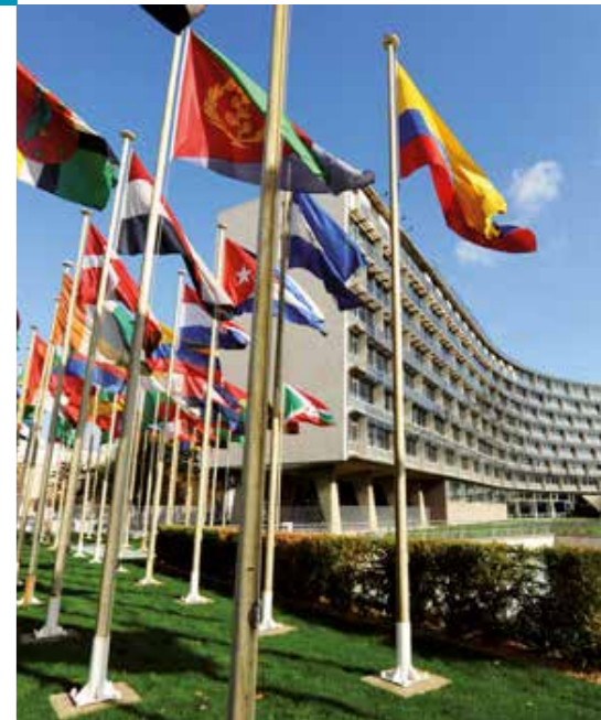
Het hoofdkwartier van Unesco in Parijs.

Het is Unesco’s missie om een bijdrage te leveren aan wereldwijde vrede, uitroeiing van de armoede, duurzame ontwikkeling en een interculturele dialoog door middel van onderwijs, wetenschap, cultuur, communicatie en informatie. Unesco is ervan overtuigd dat het van wezenlijk belang is om te leren over de Holocaust. Op die manier kunnen we beter begrijpen hoe Europa is kunnen afglijden naar deze genocide. Zo krijgen we een inzicht in de daaropvolgende ontwikkeling van het internationaal recht en de internationale instellingen die erop gericht zijn genocide te voorkomen en te bestraffen. Door een zorgvuldige vergelijking met andere voorbeelden van massaal geweld kunnen wij bijdragen aan het beter begrijpen van de onderliggende mechanismen en de preventie van toekomstige genocides of andere vormen van grootschalige gruweldaden.