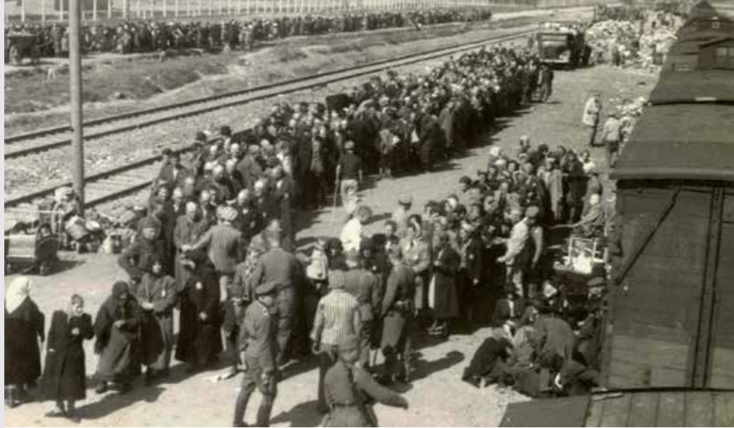
Birkenau, Polen: selectie op het perron, 27 mei 1944.

“Als barbaarsheid inherent is aan onze beschaving, dan moet het onderwijs tot doel hebben om de potentiële onbeschaafdheid ervan te onthullen.”