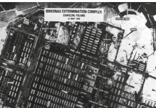
Het nazi-Duitse concentratie- en vernietigingskamp Auschwitz-Birkenau werd in 1979 ingeschreven op de Werelderfgoedlijst van Unesco.

Het gebruik van de radio tijdens de genocide op de Tutsi in Rwanda voor de verspreiding van racistische propaganda en om de moordenaars te helpen hun slachtoffers op te sporen, is daar een duidelijk voorbeeld van. De drones die de grote legers vandaag inzetten om vanop een veilige fysieke maar ook morele afstand mensen te doden, zijn daarvan een ander voorbeeld. Het besef van de macht en mogelijkheden van technologie kan leerlingen helpen bij het bestuderen van hedendaagse gevallen van mensenrechtenschendingen, en kan leiden tot politieke acties om dergelijke schendingen te voorkomen. Aandacht hiervoor is erg belangrijk, zeker gezien de enorme technologische evolutie van de laatste jaren.