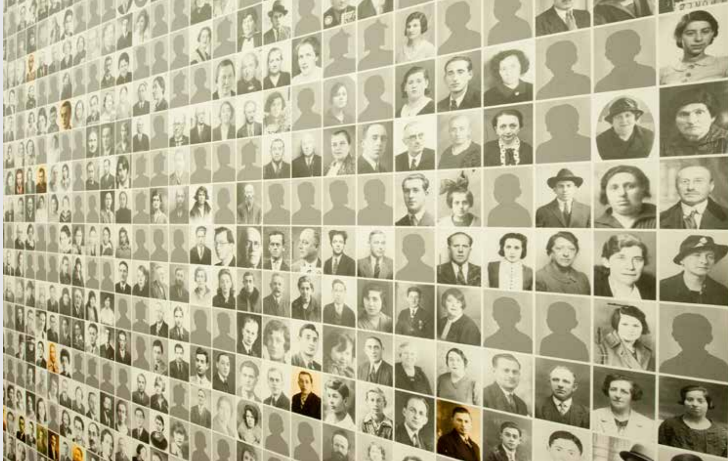
De herdenkingsmuur met portretten in Kazerne Dossin