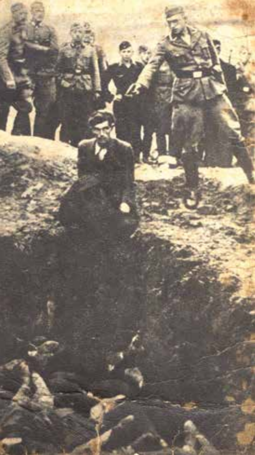
Vinnitza, Oekraïne: Duitse soldaten kijken toe hoe een lid van de Einsatzgruppen een Jood vermoordt, juli 1941.

verpleegsters aan het euthanasieprogramma Aktion T4 van nazi-Duitsland, dat leidde tot de moord op meer dan 200.000 geestelijk of lichamelijk gehandicapten en psychiatrische patiënten (mannen, vrouwen en kinderen boven de 6 jaar). Of de deelname van gewone Duitse soldaten aan de moord op meer dan een miljoen Joden, een van de opdrachten voor de Einsatzgruppen (speciale doodseskaders) in het oostelijke deel van Europa. Dit zet aan tot nadenken over het menselijk gedrag, gehoorzaamheid, conformisme en de kracht van een ideologie; over de aansluiting van een hele samenleving bij een regering die de internationaal erkende mensenrechten met de voeten treedt.