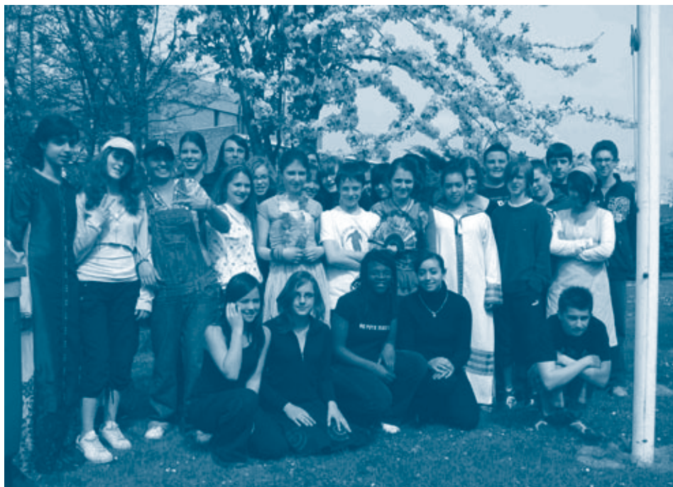
De leerlingen van de Middenschool te Sint-Truiden

Hoe kunnen we dan onze boodschap verkondigen? Wat is universeel? Meteen werd er gedacht aan de media: TV en radio.