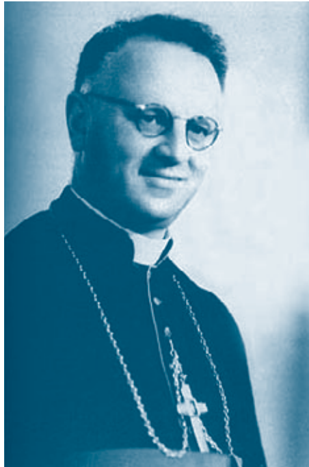
Pierre-Marie Théas, stichter Pax Christi

Deze brief heeft de christelijke gemeenschap in Théas' bisdom en in Frankrijk wel degelijk wakker geschud, en in weerwil van de antisemitische politiek van het collaborerend regime van Vichy deed Théas vanaf dat moment er alles aan om een beslissende strijd aan te binden met het antisemitisme. Hij bood hulp en onderdak aan joden op de vlucht en weigerde maarschalk Pétain te ontvangen tijdens een officieel bezoek.