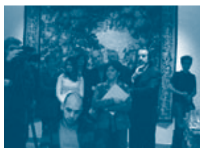
Persconferentie in de Fortis-bank, Meir, Antwerpen.