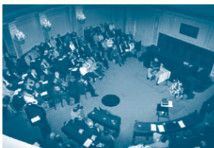
Uitreiking van de Vredesprijs in het Antwerpse Vredescentrum.

Het project " thuis in de Stad " kreeg de Vredesprijs.