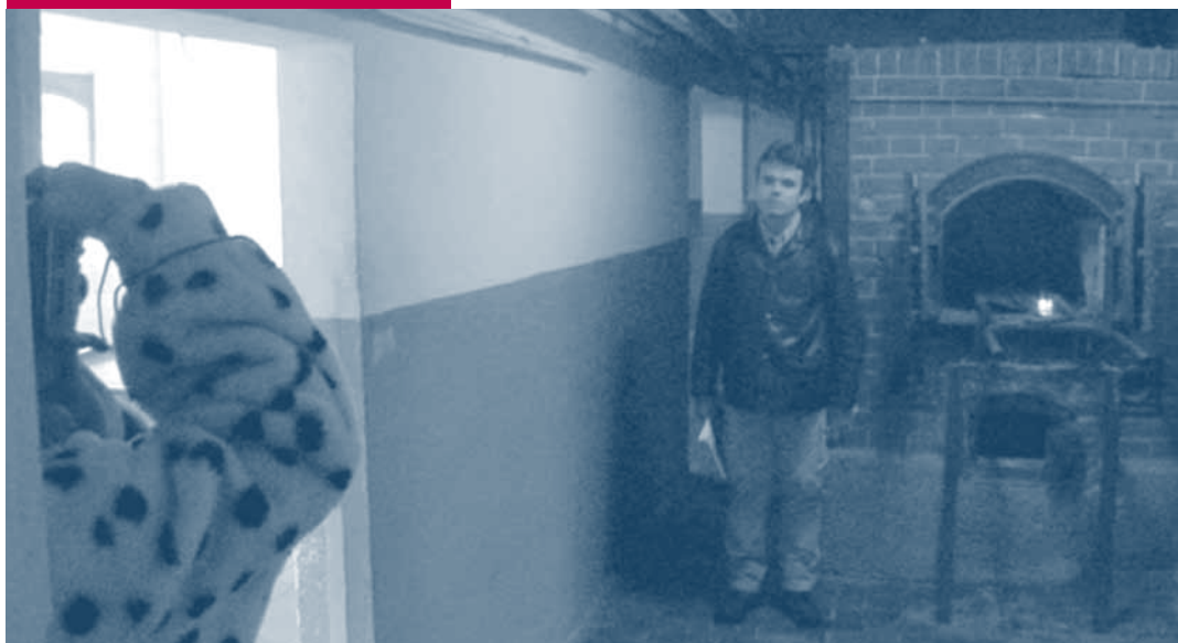
← Een koppel maakt een foto naast één van de verbrandingsovens van Mauthausen.