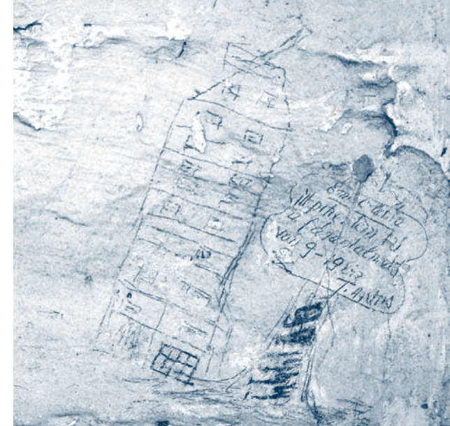
← Afbeelding op huisnummer 453 van de Louizalaan.

Tijdens de studiedag, die doorging in de Koninklijke Bibliotheek Albert I, op 21 oktober 2011, werden lezingen gebracht