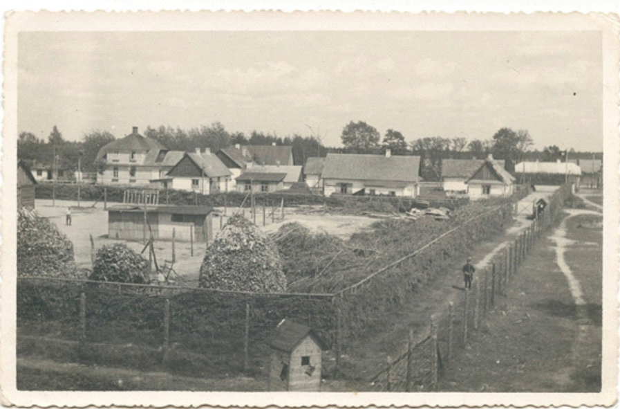
◀ Het moordcentrum Sobibór. Zicht op Lager I en, op de achtergrond, de huizen van de Vorlager. Afbeelding uit het Niemann-Album.

begin juli, besloot hij echter Sobibór om te vormen tot een concentratiekamp, een depot voor buitgemaakte munitie. Met de bouw van Lager IV, of het 'noordelijke kamp', werd toen onmiddellijk begonnen. Op 14 oktober 1943 kwamen de Arbeitsjuden echter in opstand en ontsnapten ongeveer 300 gedetineerden. Ongeveer 50 overleefden de oorlog. Het plan om Sobibór als munitiedepot te gebruiken werd afgeblazen en het moordcentrum werd in november 1943 met de grond gelijk gemaakt. Sobibór bestond uit vijf kampen, alle binnen het gebied dat omgeven was door puntdraadversperringen en mijnevelden. Het eerste kamp was het Vorlager , of voorkamp, met de huizen en barakken van de SS'ers en de Oekraïense hulpstroepen. De belangrijkste structuur van het voorkamp was het huis van de commandant. Het 'lopende band' proces van de uitroeiing in Sobibór begon op het treinplatform tegenover het voor-