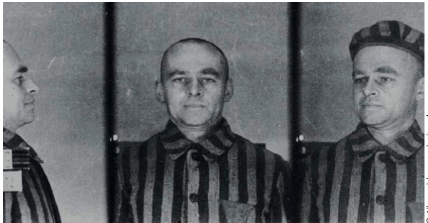
▲ Pilecki gefotografeerd bij zijn aankomst in Auschwitz.

In het voorjaar van 1940 lopen de eerste berichten binnen over een kamp met de naam Auschwitz, naar waar de nazi's verslagen Poolse tegenstanders en soldaten deporteren. Twee leden van zijn