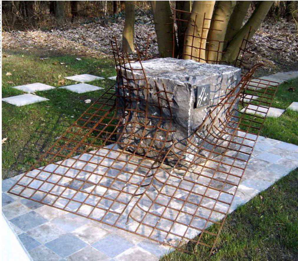
▲ Monument opgericht in 2004 door Belgische en Duitse vrijmetselaars ter nagedachtenis van het vrij denken onder de bezetter.