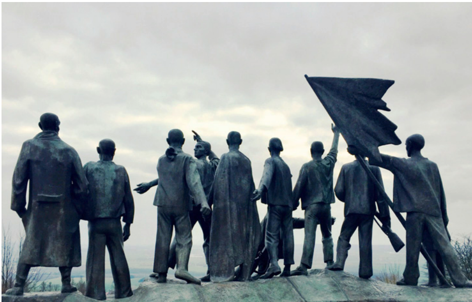
◀ Lumière et Liberté, herinneringssite van Buchenwald.