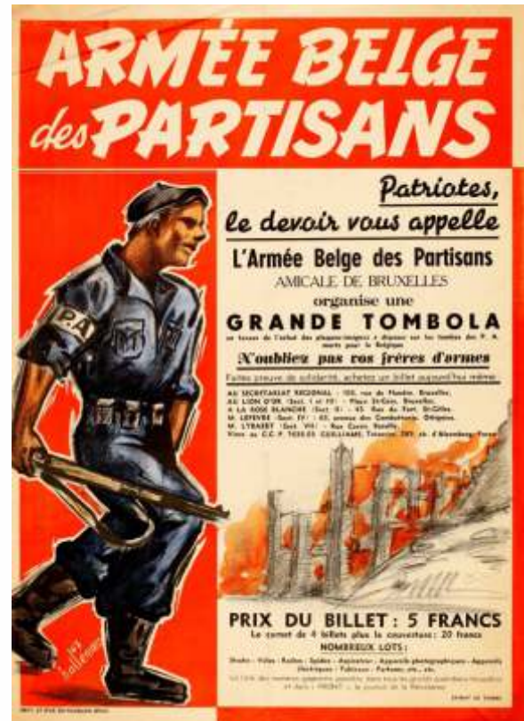
De verenigingen verdedigen de materiële en morele belangen van voormalige verzetsstrijders en houden de herinnering in stand (Affiche van de vereniging van het Belgisch leger der partizanen, Brussel, 1947)

worden. De opkomst van de herdenking van de Holocaust voltooit het afbraakproces waar de herinnering aan het Verzet al een tijd mee te kampen had. De aandacht gaat nu naar de Joodse slachtoffers van de oorlog, die decennialang onzichtbaar zijn gebleven. De rassenvolgeningen gaan de collectieve herinnering aan de oorlog domineren. In de jaren 1990 zal dit echter drastisch veranderen. De heropleving van extreemrechts leidt ertoe dat de politiek steeds meer belangstelling toont voor deze periode en de 'herdenkingsplicht' als een bolwerk van de democratie gaat voorstellen. De herinnering aan de oorlog wordt in het teken van de mensenrechten geplaatst waarin de genocide op de Joden centraal staat. Van nu af aan worden alle vervolgingen en alle vormen van onderdrukking en geweld herdacht. Het Verzet raakt op de achtergrond en verdwijnt zelfs helemaal uit het collectieve geheugen, zeker in Vlaanderen.