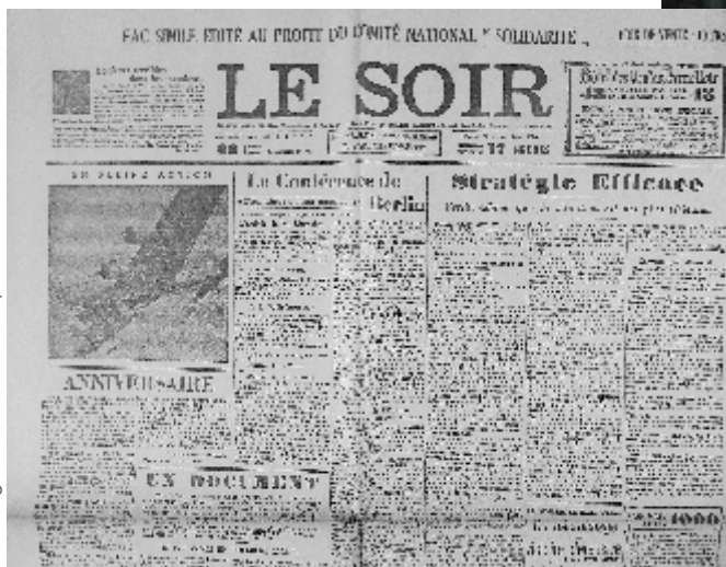
Foto 5: Exemplaar van de reproductie van de valse 'Soir', archieven van J. Misguich