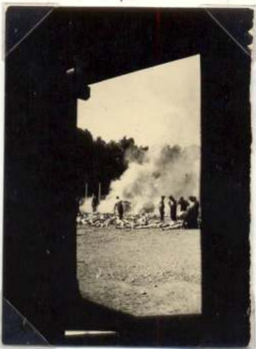
◀ Foto genomen vanuit Krematorium V in Birkenau om de lijkverbrandingen te illustreren aan het einde van Aktion Höß , waarbij zo'n 312.000 Hongaarse Joden werden vermoord tussen half mei en begin augustus 1944

saties het identificeren van mogelijke militanten om zich te beschermen tegen de infiltratie van spionnen. De doelstelling om de levensomstandigheden in het kamp te verbeteren hield onder meer in dat gewone gevangenen werden vervangen door politieke geïnterneerden om de functie van Kapo of andere belangrijke functies op te nemen. De titel van Kapo of Prominent (bevoorrechte kampgedetineerde) gaf vaak macht op leven en dood over de geïnterneerden. De politieke Kapo 's hadden veel macht om de afranselingen te laten verminderen. Ze hadden toezicht op een gelijke verdeling van kleding en voedsel, spoorden spionnen op. Daarnaast probeerden ze de productie te saboteren, het werk van het ondergrondse comité te verdezelen enz. Soms slaagden deze Prominenten erin om in de ziekenzalen, met de hulp van geïnterneerde artsen, enkele gedetineerden die gevaar liepen wegens ziekte of gebrek of wegens hun clandestiene activiteiten in het kamp, te beschermen voor selectie en dwangarbeid. Velen van hen riskeerden hun leven,