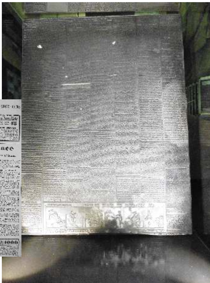
Foto 6: Fotogravureplaat van de 'valse' Soir bewaard in het Huis van het Verzet