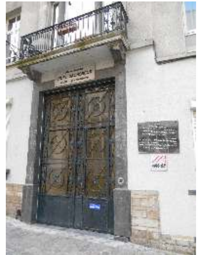
Foto 4: Toegangspoort van de basisschool van het Lyceum H. Dachsbeck

daardoor de bijnaam Le Soir volé of gestolen Soir ). Met een oplage van 300.000 was het nog steeds het meest gelezen dagblad.