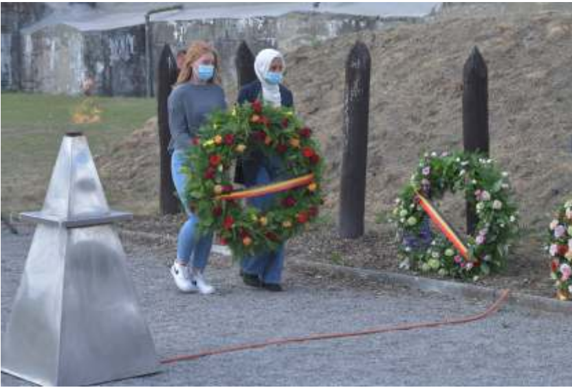
De herdenking van de Tweede Wereldoorlog vormt een belangrijk onderdeel van de burgerschapseducatie. Jaarlijkse herdenking in het Fort van Breendonk, 23 september 2020