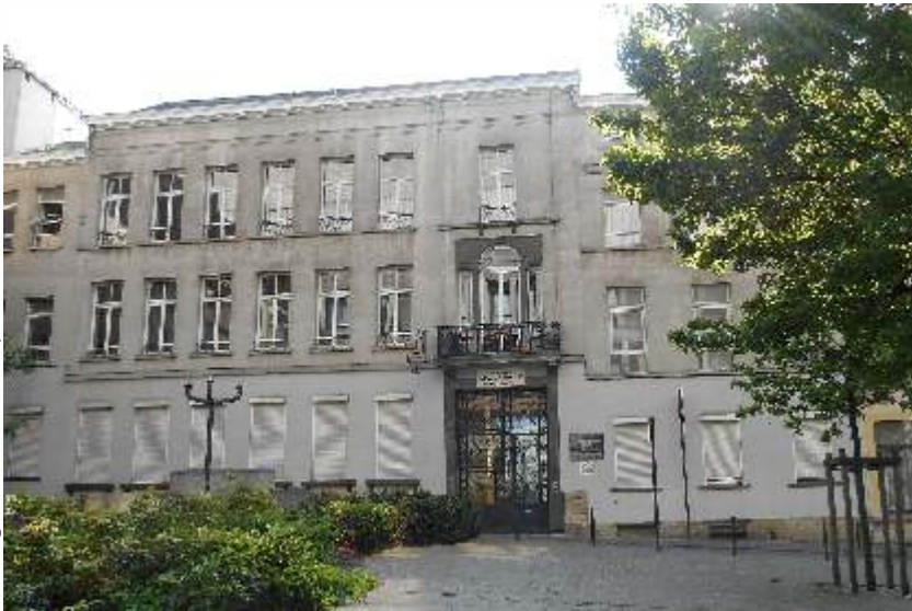
▲ Foto 3: Ruysbroeckstraat 35. De basisschool van het Lyceum H. Dachsbeck in het gebouw van de vroegere drukkerij Wellens