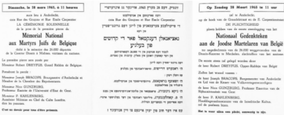
Foto 1: Uitnodigingskaart voor de plechtige ceremonie bij de eerste steenlegging van het Gedenkteken