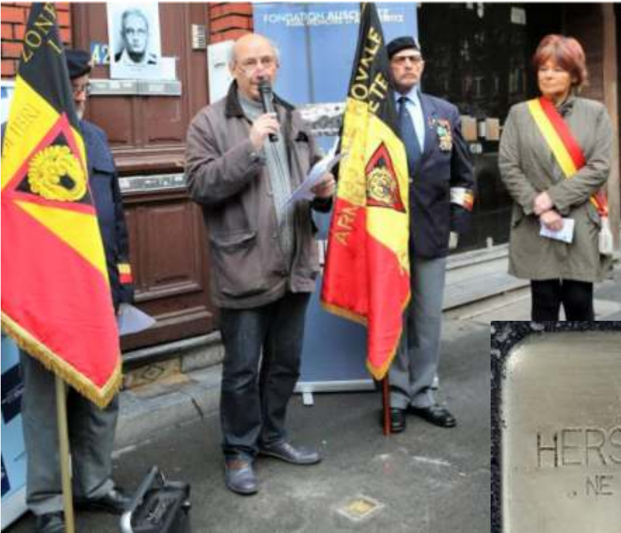
Een gedenkkassei wordt geplaatst voor de laatste woning van Hersz Dobrzinski, verzetsstrijder gefusilleerd op 14 juli 1943 op de Nationale Schietbaan (Charleroi, 8 oktober 2019)