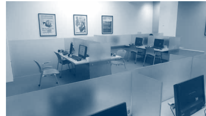
↓ Het visueel centrum. Hier kunnen duizenden films, ficties en getuigenissen - allen gerelateerd aan de Holocaust - bezichtigd worden.