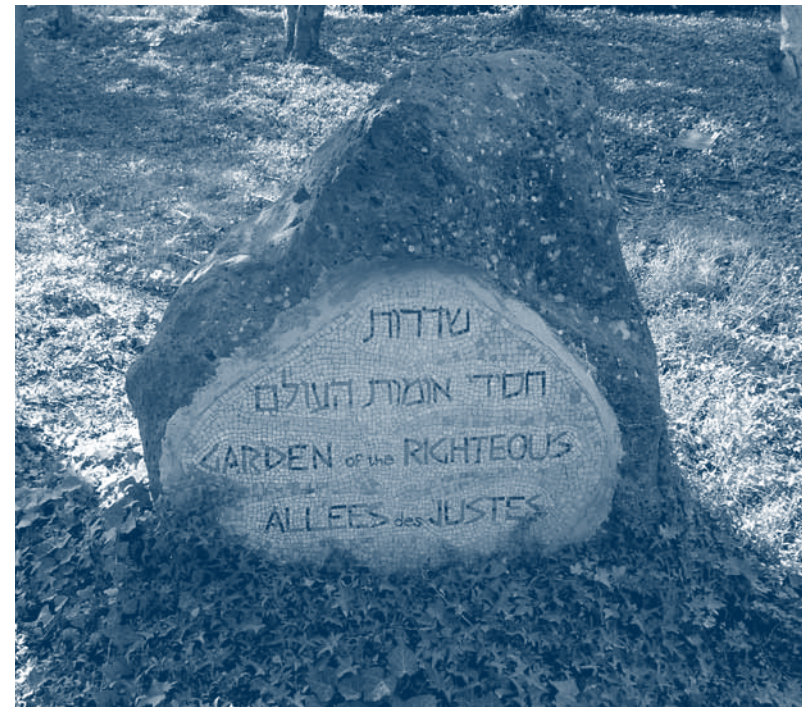
← De tuin van de “Rechvaardigen onder de Volkeren”. Hier worden bomen geplant ter ere van mensen die - meestal op gevaar van eigen leven – Joden hebben gered tijdens de Holocaust. Meer dan 16 000 mensen kregen reeds deze titel.