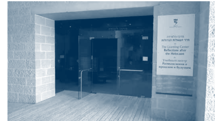
↑ Het studiecentrum. Bezoekers kunnen hier antwoorden krijgen van grote historici, filosofen en denkers op veel gestelde vragen betreffende de Holocaust. Een dergelijk centrum zal ook in Auschwitz geopend worden op 27 januari 2013.