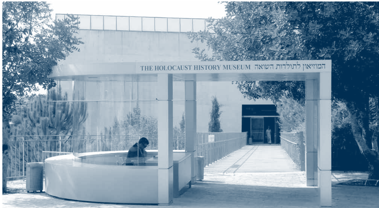
↑ Ingang van het Museum van Yad Vashem. Hier wordt op chronologische wijze ingegaan op de geschiedenis van de Holocaust.

— Op woensdag 17 oktober bracht de ploeg van de Stichting Auschwitz – vzw Auschwitz in Gedachtenis een bezoek aan het Yad Vashem Holocaustmuseum te Jeruzalem. Yad Vashem dat letterlijk ‘hand en naam’, maar overdrachtelijk ‘Gedenkteken’ betekent in het Hebreeuws, is het officiële monument van de staat Israël voor de herdenking van de Joodse slachtoffers van de Holocaust. Het monument werd in 1953 opgericht en in 2005 werd de nieuwe, uitgebreide tentoonstelling aan het publiek gepresenteerd.